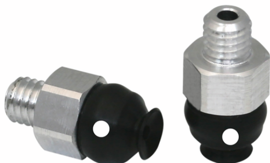
PFYN 3.5 FPM-65 M3-AG

真空吸盘PFYN(橡胶件+吸盘接头出厂时各部件未经装配成一体(直径120mm及以上的吸盘经装配成一体后供货)。该订购编号包含：