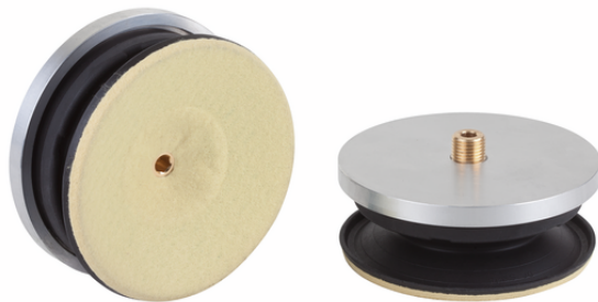
SPL-HT 90 FPM-F-65 G1/4-AG

吸盘SPL-HT FPM-F（弹性体部分+插座）是组装后提供的。该产品由以下部分组成。