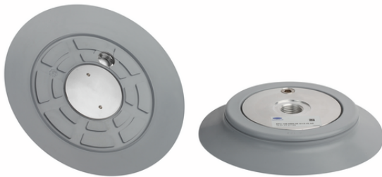
SPU 160 NBR-55 G1/2-IG AE