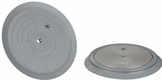
SPU 360 NBR-55 G1/2-IG B