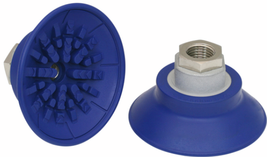
SAF 60 NBR-60 G1/4-IG