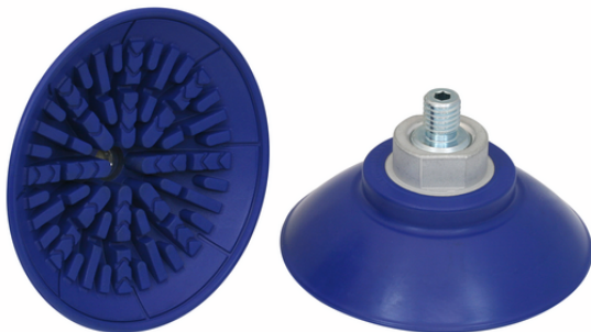
SAF 80 NBR-60 M10-AG