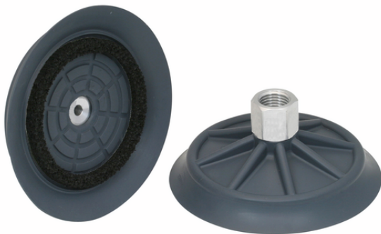
SHFN 85 NK-45 G1/4-IG MOS