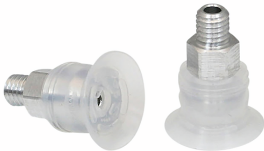
SGPN 15 SI-50 M5-AG