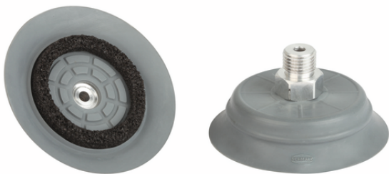
SHFN 70 NK-45 G1/4-AG E MOS