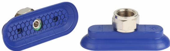
SAOG-S 80x30 NBR-60 G3/8-IG