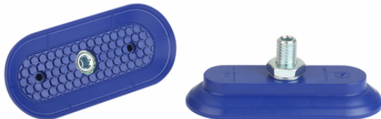
SAOG-S 95x40 NBR-60 M10-AG