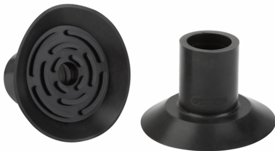
SGP 34 FPM-65 N033