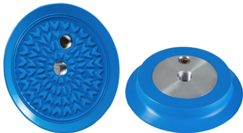
SGF 125 HT1-60 G3/8-IG