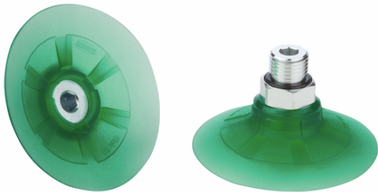
SPF 50 ED-65 G1/4-AG

真空吸盘SPF(橡胶件+吸盘连接件)经装配成一体后供货。如您希望各部件到货时未经装配成一体，请按照以下步骤进行订购：