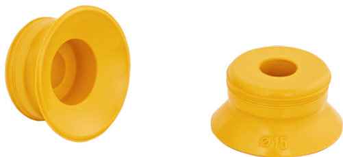
PFG 15 NBR-ESD-55 N005