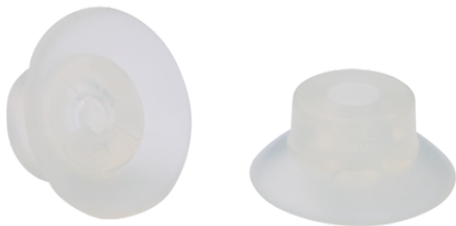
SUF 30 SI-55 SC040