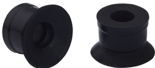
SUF 5 SI-CO-55 SC020