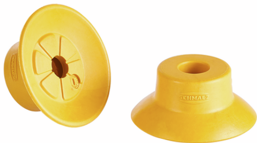
SUF 20 NBR-ESD-55 SC030