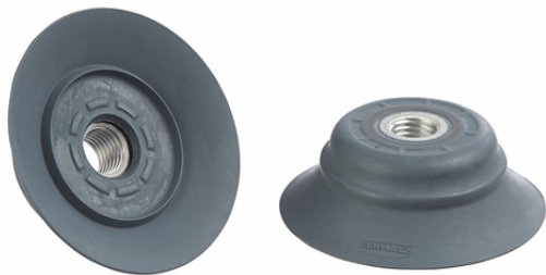
SHF 50 NK-45 M10x1.25-IG E