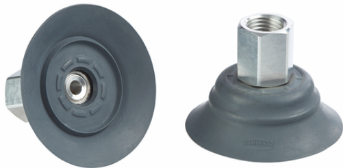
SHFN 50 NK-45 G1/4-IG E