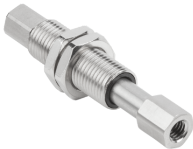
FSTIm M5-IG M5-IG A 20 IN