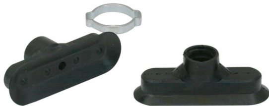
SGO 60x20 NBR-55 N023