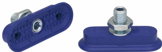
SAOF 60x23 NBR-60 M10-AG