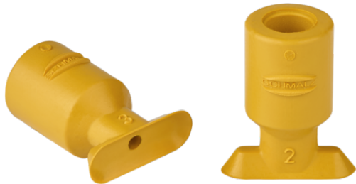
SGO 12x4 NBR-ESD-55 N020