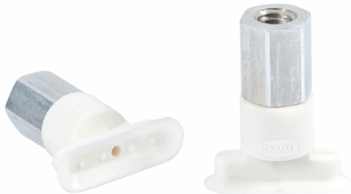
SGON 18x6 SI-HD-65 M5-IG