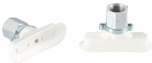
SGON 60x20 SI-HD-65 G1/4-IG