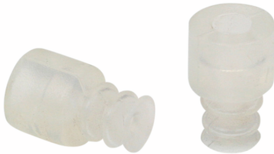
FG 7 SI-55 N016