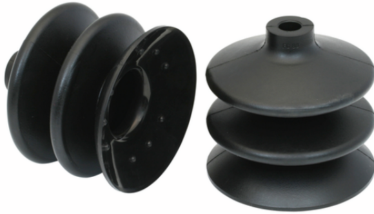
FG 88 NBR-55 N019