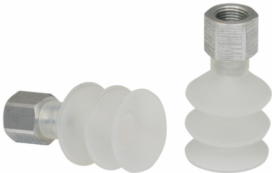
FSG 25 SI-55 G1/8-IG

吸盘FSG（弹性体部件+连接头）以未组装状态交付（直径32mm及以上型号为组装状态）。交付内容包括：