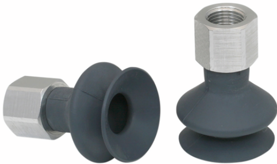
FSGA 25 NK-45 G1/8-IG

吸盘FSGA（弹性体部分+连接接头）在供货时没有装配（从直径33mm开始装配）。交付的内容包括。