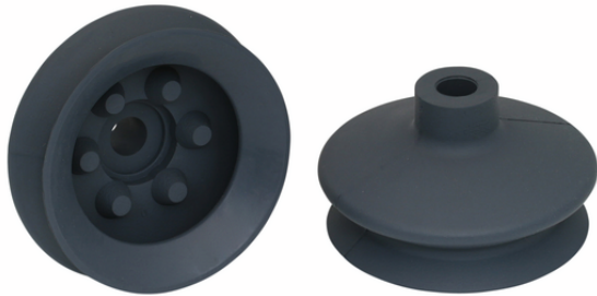
FGA 78 NK-45 N019