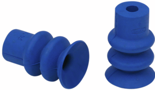
FG 14 HT1-60 N016