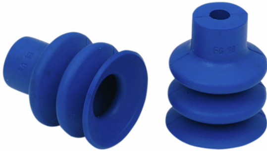
FG 18 HT1-60 N016