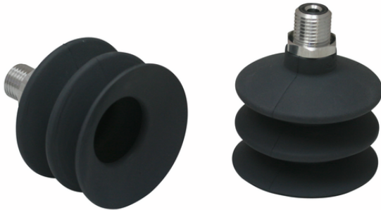
FSG 52 NK-45 G1/4-AG

吸盘FSG（弹性体部件+连接头）以未组装状态交付（直径32mm及以上型号为组装状态）。交付内容包括：