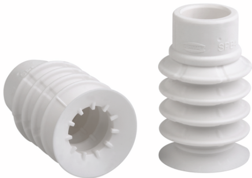
SPB4 50 SI-HD-65 SC090

吸盘SPB4（弹性体部分+连接元件）是组装后交付的。另外，吸盘也可以按其单独的部分订购，为此需要进行以下订购步骤。