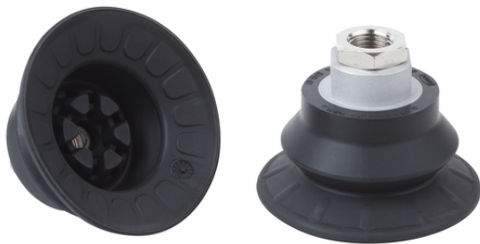
SAB 60 HT2-65 G1/4-IG

真空吸盘SAB HT2,多种吸盘直径可选,发货前吸盘接头和橡胶件已经硫化固定成一体。