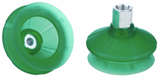
SPB1 80 ED-65 G1/4-IG