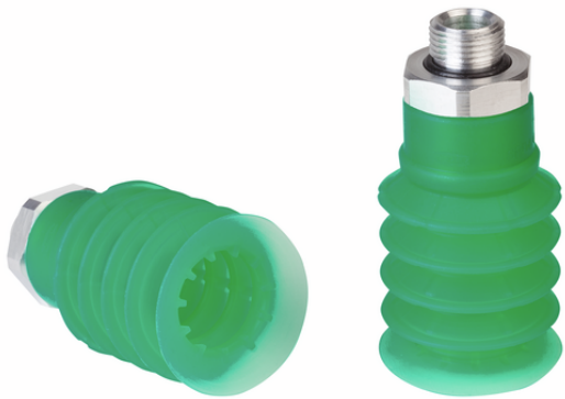
SPB4 40 SI-55 G1/4-AG