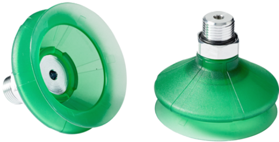
SPB1 80 ED-65 G1/2-AG