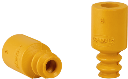
FG 4 NBR-ESD-55 N017