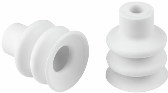
FG 18 SI-HD-65 N016