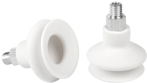
FSGA 22 SI-HD-65 M5-AG

吸盘FSGA（弹性体部分+连接接头）在供货时没有装配（从直径33mm开始装配）。交付的内容包括。