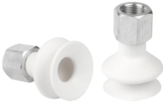
FSGA 25 SI-HD-65 G1/8-IG

吸盘FSGA（弹性体部分+连接接头）在供货时没有装配（从直径33mm开始装配）。交付的内容包括。