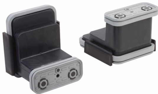
VCBL-K2 120x50x100 Q