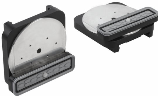
VCBL-S1 130x30x32.7 D-360 TV