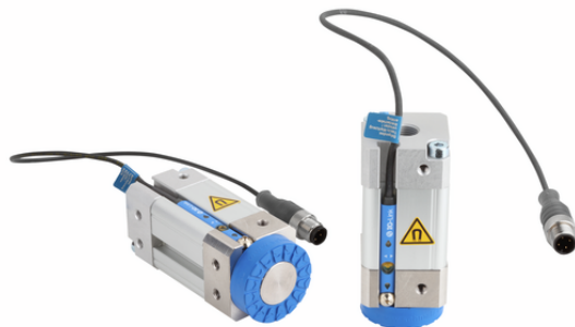
SGM-HD-S 30 G1/8-IG PNP