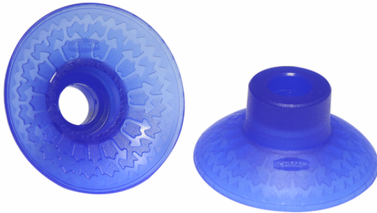
SAXM 40 ED-85 SC045