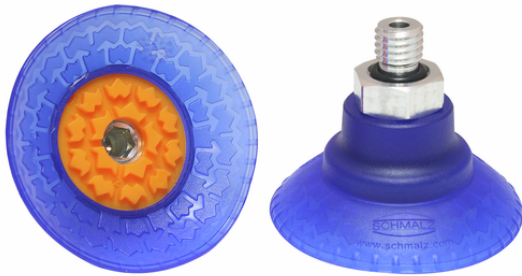
SAXM 50 ED-85 M10-AG

钟形真空吸盘SAXM(橡胶件+吸盘连接件)经装配成一体后供货。如您希望各部件到货时未经装配成一体，请按照以下步骤进行订购：