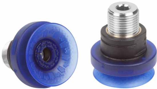
SAX 30 ED-85 G3/8-AG RP