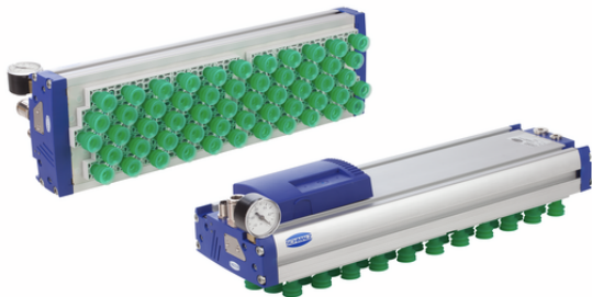
FXP-S-SW90 442 5R36 SPB2-20-P F